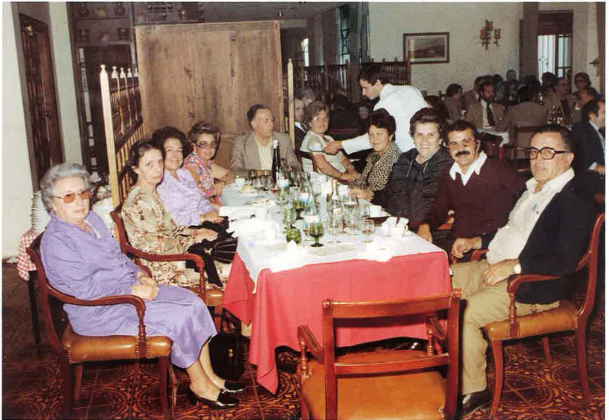
Nº: 23 Muchos de los que se fueron