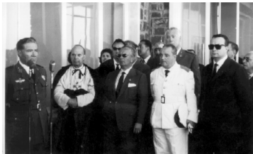
Fotografía 28: El presidente de la Diputación, Rafael Cabello de Alba en la Inauguración del aeropuerto de Córdoba, 25 de mayo de 1958

LA DIPUTACIÓN COLABORÓ ESTRECHAMENTE CON EL AYUNTAMIENTO DE LA CAPITAL PARA LA CREACIÓN DEL AEROPUERTO, COMO MEJORA DE LOS MEDIOS DE COMUNICACIÓN, DENTRO DEL ÁREA DE COOPERACIÓN.