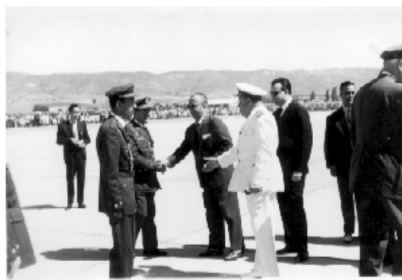
Fotografía 29: Inauguración del aeropuerto de Córdoba, 25 de mayo de 1958