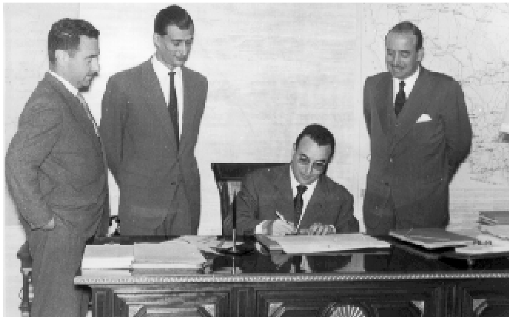
Fotografía 23: Firma del contrato para la construcción del edificio de la Caja Provincial de Ahorro. 20 mayo 1959

LA DIPUTACIÓN CONTRIBUYÓ A LA CREACIÓN DE LA CAJA PROVINCIAL DE AHORROS, AL OBJETO DE PRESTAR AYUDA FINANCIERA A LOS MUNICIPIOS