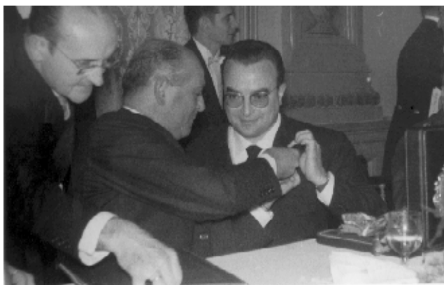
Fotografía 27: Visita del Ministro José Solís e imposición al Presidente de la Diputación de la Gran Cruz del Mérito Civil. 5 de febrero de 1962.