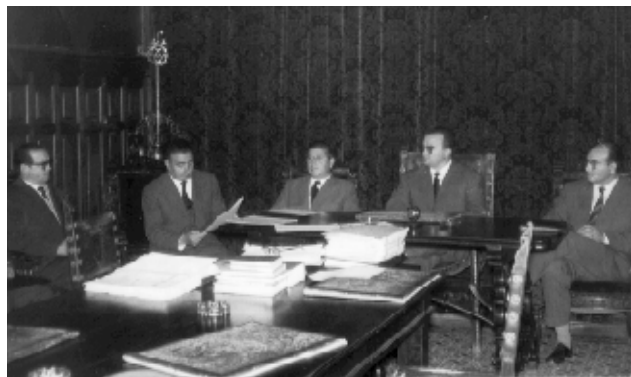
Fotografía 26: Firma de la escritura de un presupuesto extraordinario para la construcción de mercados y mataderos. 31 de octubre de 1961.

EN LA LÍNEA DE LA COOPERACIÓN SE CONTRIBUYÓ A LA CONSTRUCCIÓN DE EDIFICIOS PARA EL ABASTECIMIENTO DE LOS PUEBLOS.