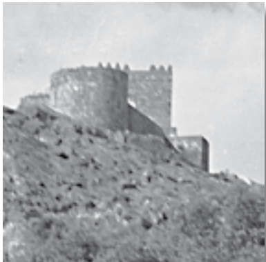
Detalle del castillo.