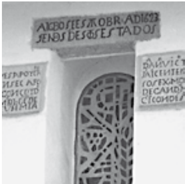
Detalle de la inscripción de la parte superior del vano, que remite a la finalización de las obras en el año 1623.