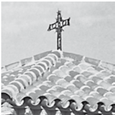
Detalle de la cruz de forja que corona la construcción destinada al culto de imágenes religiosas.