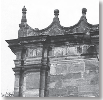
Detalle de la cornisa festoneada y rematada con esferas, de la cornisa y de la terminación de una de las pilastras del cuerpo superior.