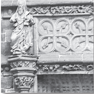
Detalle de la Virgen con niño, sobre el conopio del arco inserto en el alfiz de la portada.