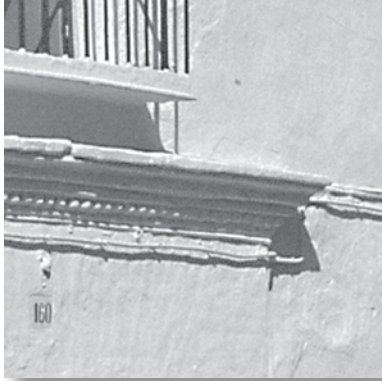
Detalle de la disposición de las molduras del tejeroz, también conocido como tejadillo en voladizo o cornisa.