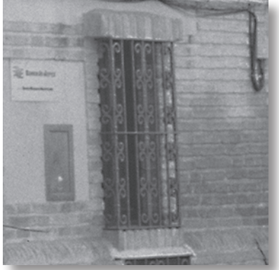
Detalle de las ventanas cubiertas con guardapolvos, que destacan por su sencillez en la disposición del ladrillo.