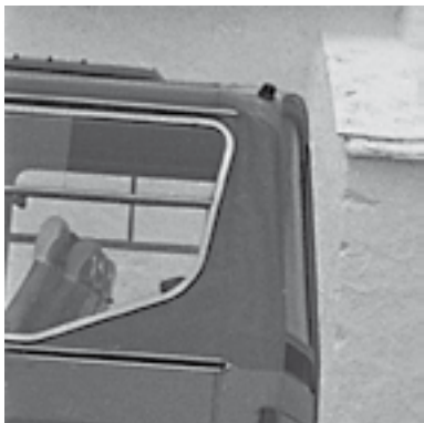
Detalle de la trasera del autobús, significativo de los nuevos tipos de transporte de viajeros.