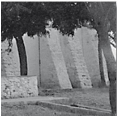
Ermita que presenta al exterior contrafuertes dispuestos en talud.