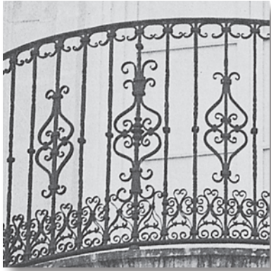
Detalle de la rejería del balcón central.