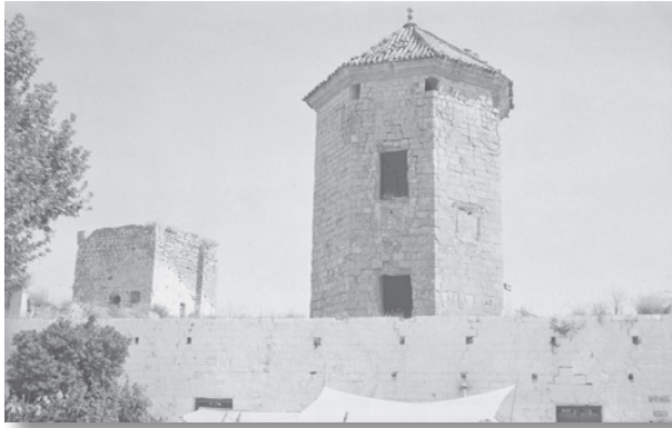
La Torre del Moral en primer plano y la Torre del Homenaje al fondo. Ambas formadas tras la Reconquista.