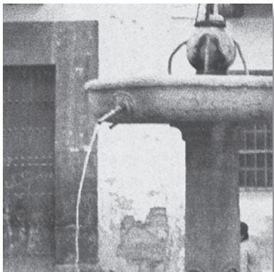
Detalle de uno de los caños.