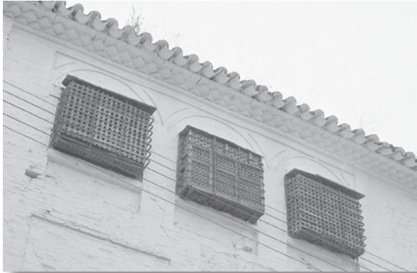
Ventanas del convento de religiosas Agustinas al que se acopla la Iglesia de San Martín formando un completo conjunto arquitectónico situado en la calle San Pedro.