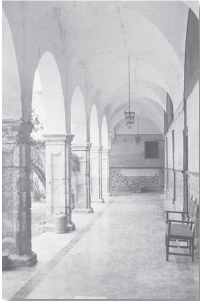
Detalle del claustro del Hospital de San Juan de Dios.