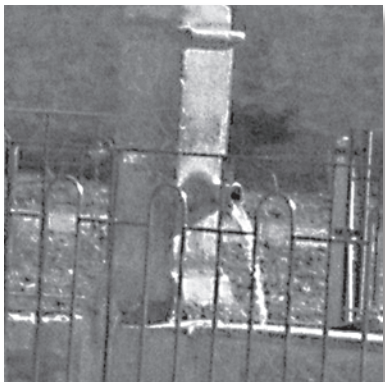
Detalle de uno de los caños que da nombre a la fuente.