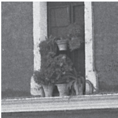
Detalle de las ventanas con las populares macetas que le dan un toque pintoresco a la fachada del edificio.