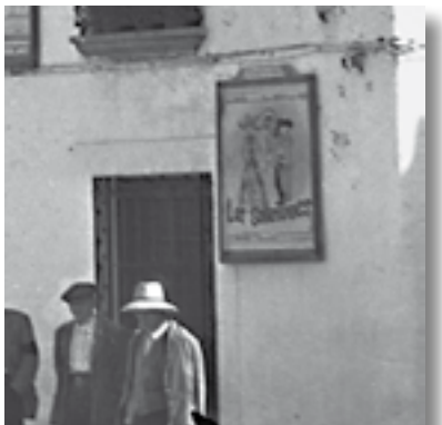
Cartel publicitario de la película cinematográfica proyectada en la localidad.