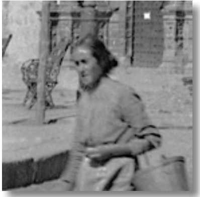
Mujer en primer término portando cubo metálico que con el tiempo será sustituido por el de plástico.