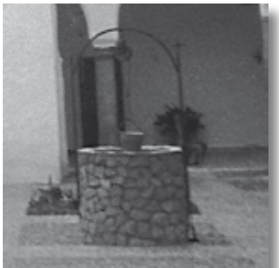
Brocal de pozo de mampostería y arco de forja que destaca por su sencillez.