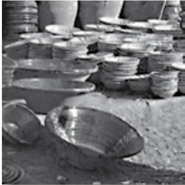
Puesto ambulante de alfarería, donde se observan útiles para la matanza como tinajas, orzas, lebrillos, etc.