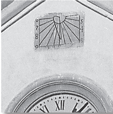
Detalle del reloj de sol que se encuentra ubicado en la parte superior de la fachada en línea con la puerta.