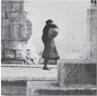
Detalle de la mujer portando los característicos cántaros de barro, necesarios para mantener el agua fresca.