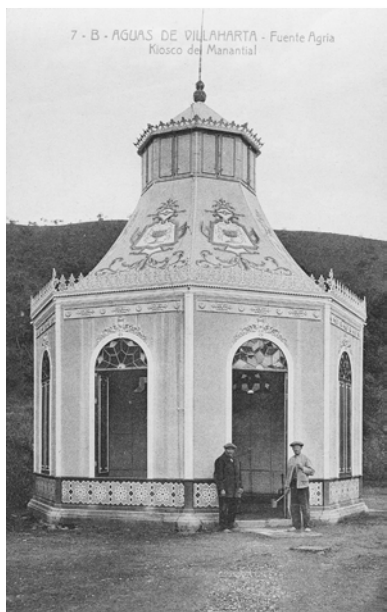
Detalle del Kiosco del Manantial que pertenecía al complejo del Balneario de Fuente Agria.