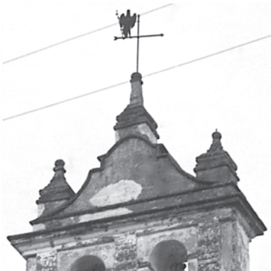
Detalle del frontón que cierra el campanario, flanqueado y rematado por pináculos.