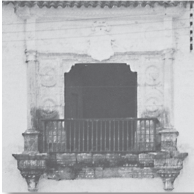
Detalle del balcón plateresco del palacio. Es un balcón saliente con rejería de forja, flanqueado por columnas estriadas sostenidas por ménsulas. Sobre la clave se sitúa el escudo nobiliario.