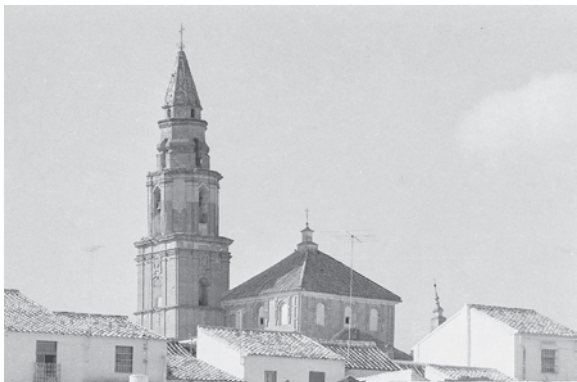
Detalle de la torre y cúpula de la parroquia que se muestran al exterior. Ambas de ladrillo visto, obras del siglo XVIII.