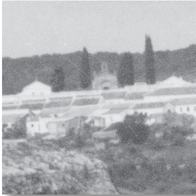
Detalle de la portada del cementerio que se encuentra flanqueada por los característicos cipreses tan habituales en estos lugares de enterramiento público.