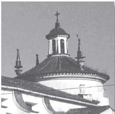
Detalle del exterior de la cúpula sobre el presbiterio, con cimborrio y linterna. Pináculos piramidales terminando en esfera decoran la cúpula.