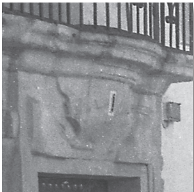
Detalle del dintel y la repisa del balcón protegido con rejería, que presenta su parte central convexa.