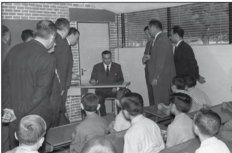
Nuevas escuelas en Castro del Río y Almodóvar 07/06/1958.