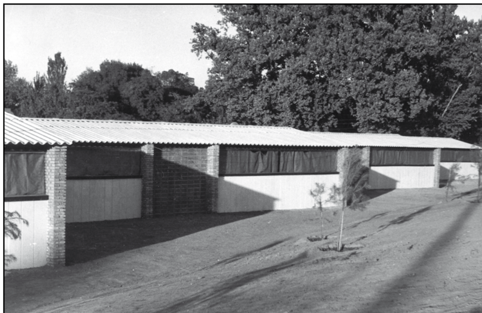
Nuevas escuelas 07/06/1958.

Plano de escuela con dos aulas. Arquitecto Rafael de la Hoz. Expediente del concurso para contratar las obras de construcción de 96 grupos de dos micro-escuelas; 26 grupos de una micro-escuela. (21-01-1959 a 01-09-1960). ADCO.