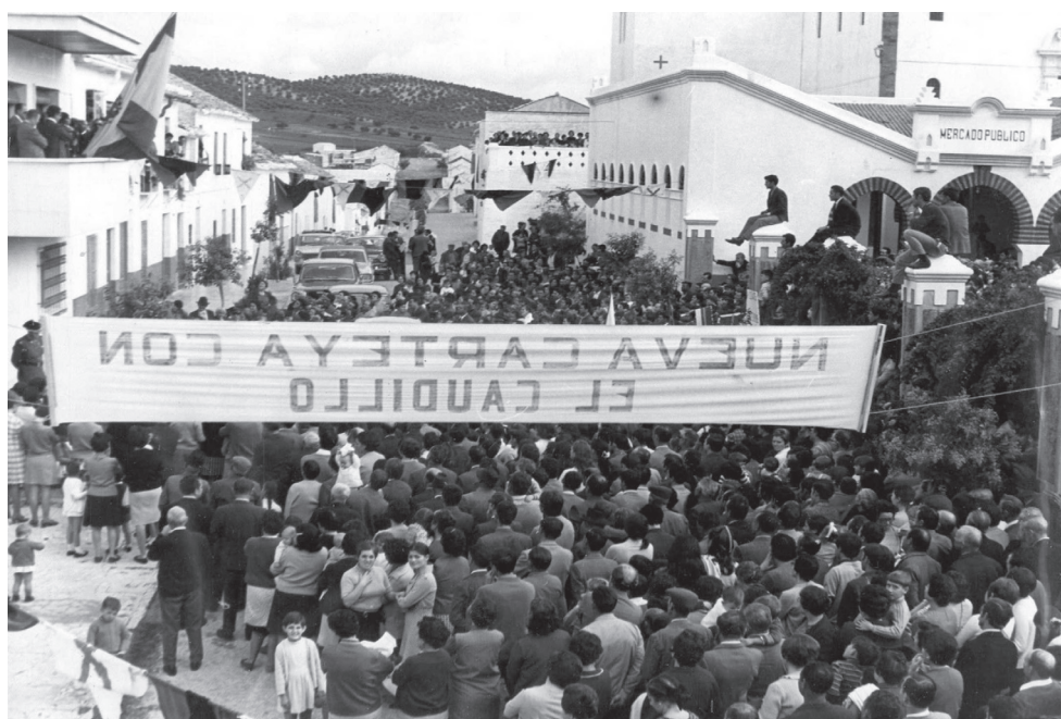
Nueva Carteya con el Caudillo, 1970.