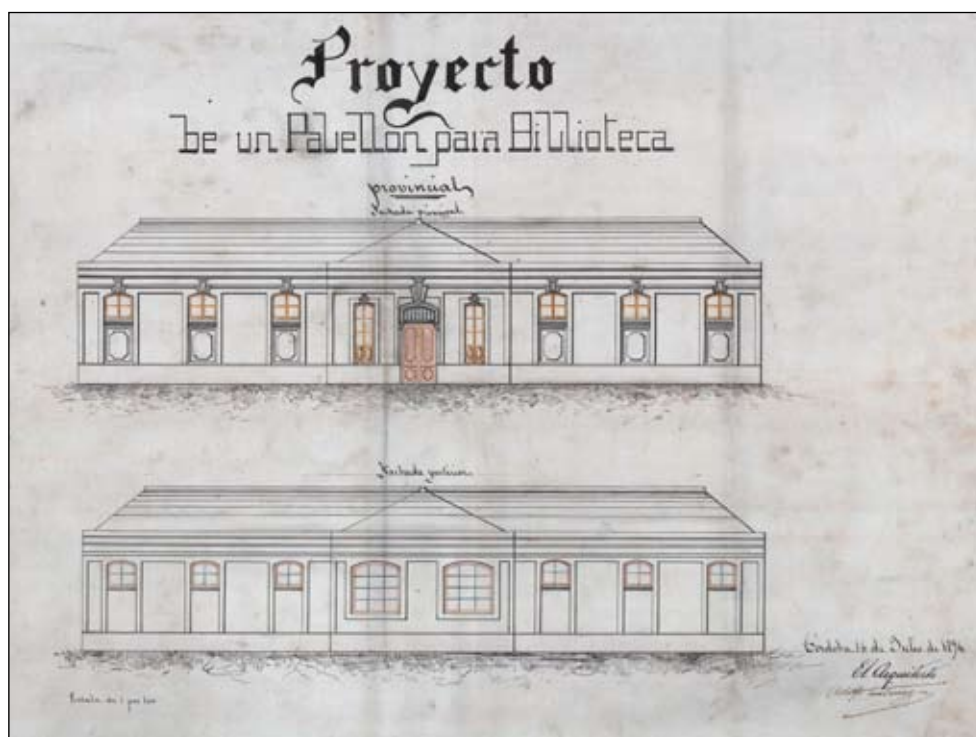
Imagen 1: Fachada principal y posterior de un pabellón para la Biblioteca provincial.

La Biblioteca Provincial permaneció en este espacio compartido por más de cien años consecutivos, hasta su traslado a la construcción contigua del Palacio Episcopal en 1984, donde actualmente todavía se encuentra. Y dicho esto, pasemos ahora a la descripción documental del proyecto que nos ocupa.