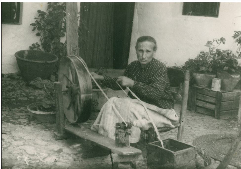
Mujer hilando. Pozoblanco.

Cuadernos del Archivo de la Diputación de Córdoba 2- 2009