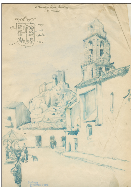
Vista de Belmez.