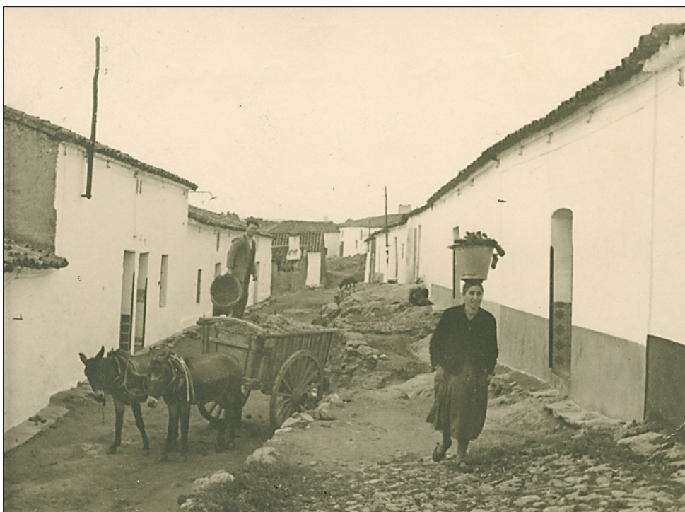
Calle de Doña Rama. Belmez.