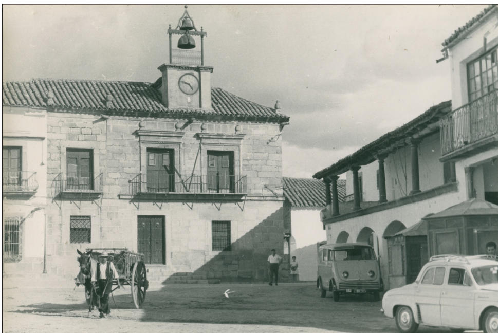
Plaza del Ayuntamiento. Dos Torres.