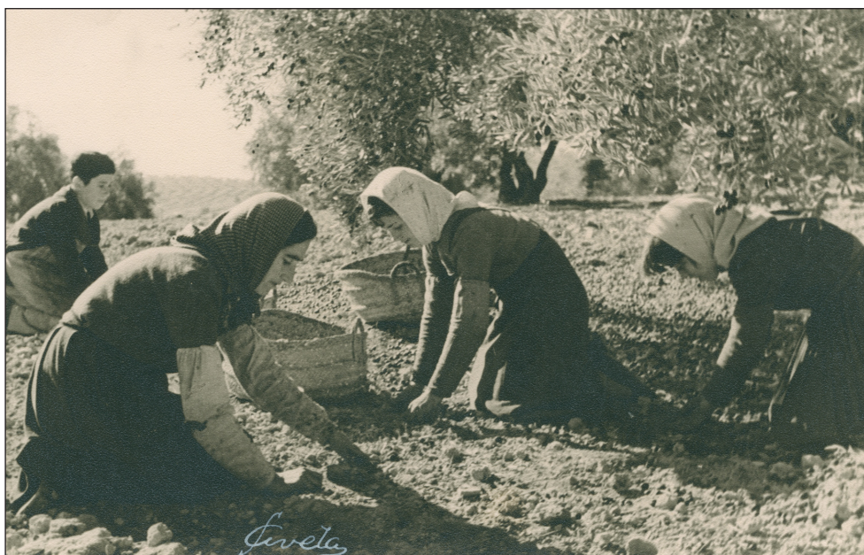
Mujeres recogiendo aceitunas. Martos (Jaén).