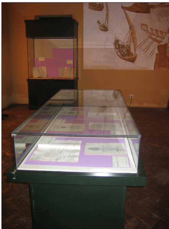
Exposición octubre 2006 III.