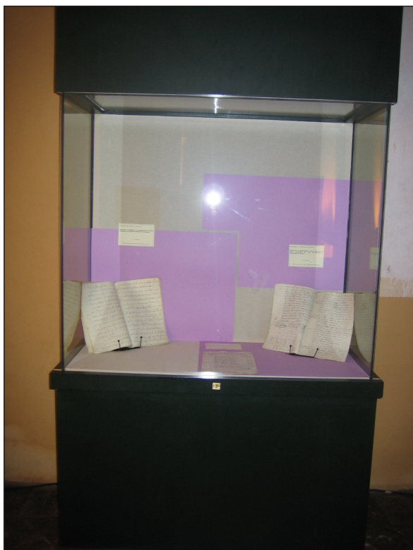
Exposición octubre 2006 II.

Cuadernos del Archivo de la Diputación de Córdoba 2 - 2009