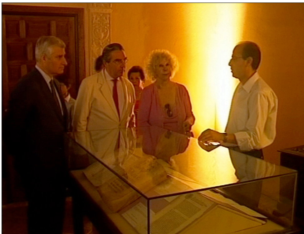
Exposición junio 2005 II.