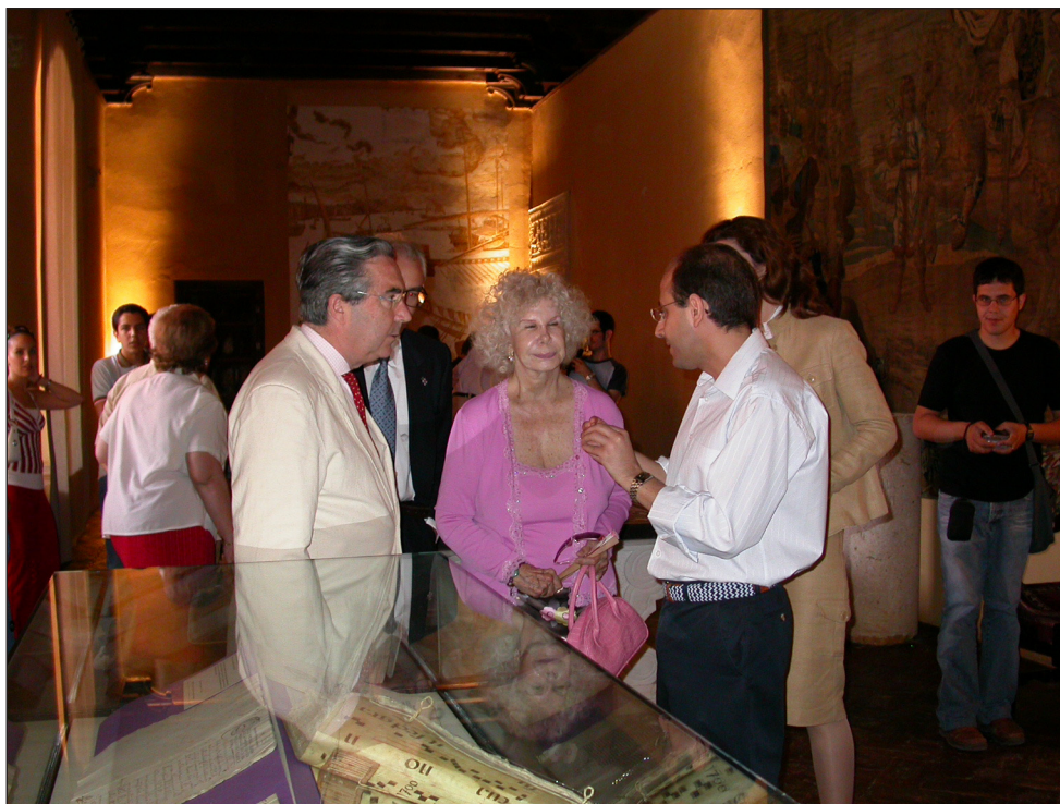
Exposición junio 2005 I.