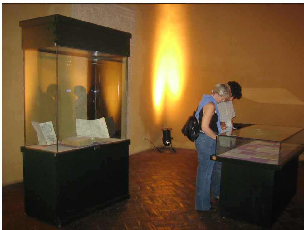
Exposición octubre 2006 I.