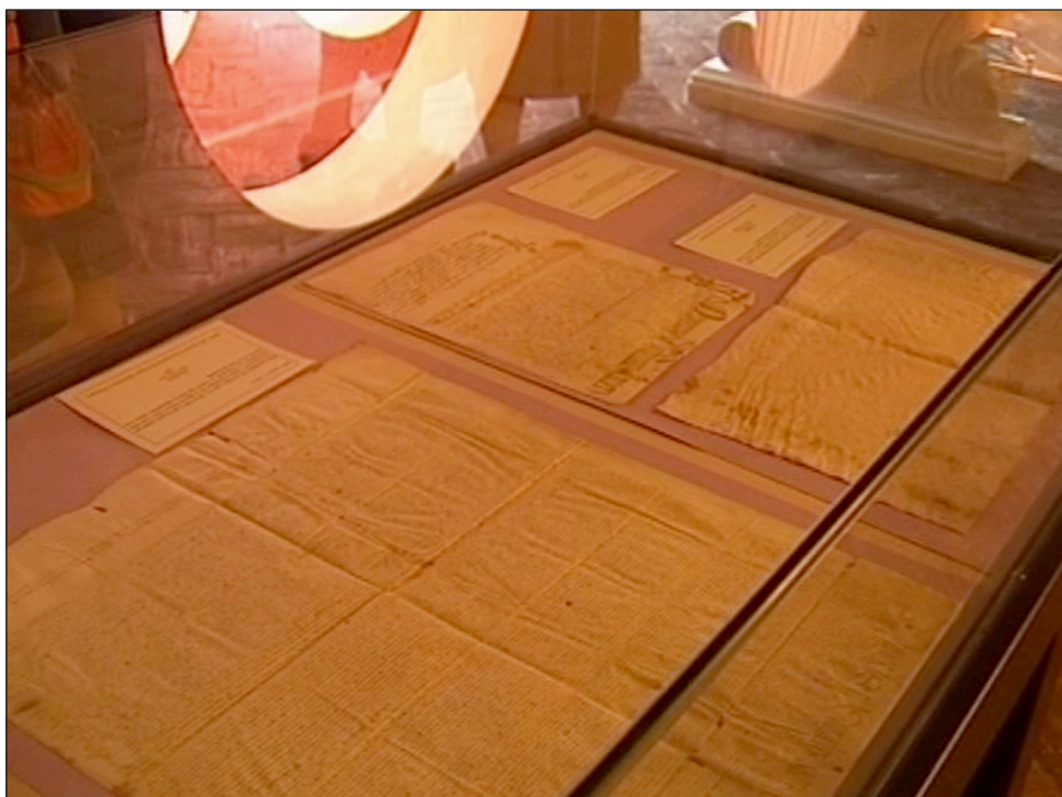
Exposición junio 2005 III.